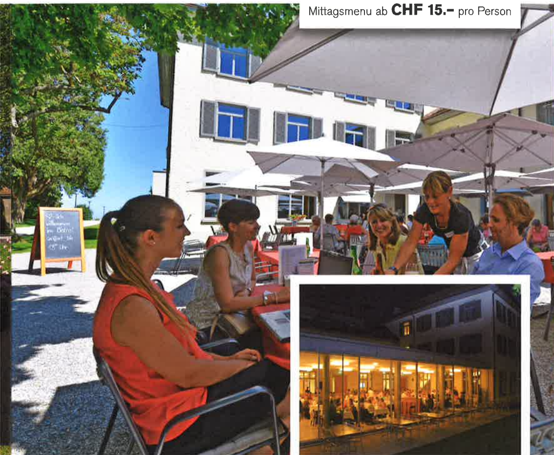
Mittagsmenu ab CHF 15.– pro Person